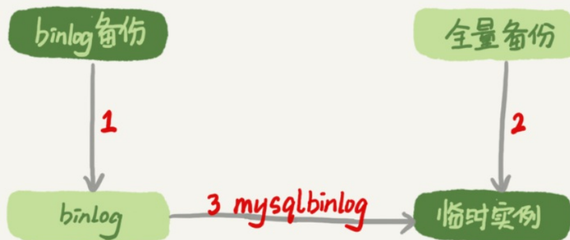
图1 数据恢复流程-mysqlbinlog方法